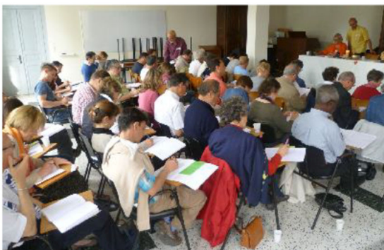
Rencontre locale sur un thème